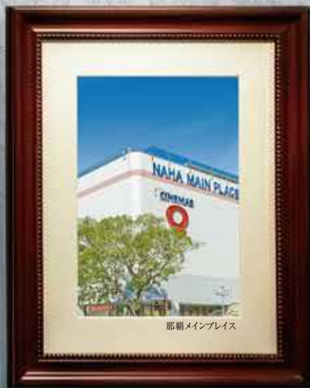
那覇メインプレイス

琉球王朝の海の玄関口・泊港のほとり、泊一丁目。閑 静な第一種住居地域に属するこの街には、ペリー提 督ゆかりの史跡等が残り、歴史と文化が感じさせる街 並みが広がります。