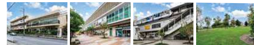
市立 泊小学校 / 徒歩4分(約280m) | さいおんスクエア国際通り店 / 徒歩10分(約750m) | ゆいレール「牧志」駅 / 徒歩10分(約770m) | 黄金森公園 / 徒歩1分(約80m)

※モノレールの所要時間は公式HPの検索機能を利用し、2026年6月の時刻表を元に算出しています。なお、待ち時間を含まないため、所要時間が変わる場合があります。※表示距離については現地からの地図上の概算距離で、徒歩分数は1分=80mで算出(端数切り上げた)ものです。なお、道路の混雑状況や信号待ちなどにより所要時間は多少異なります。※掲載の周辺施設の写実は2026年3月に撮影したものです。