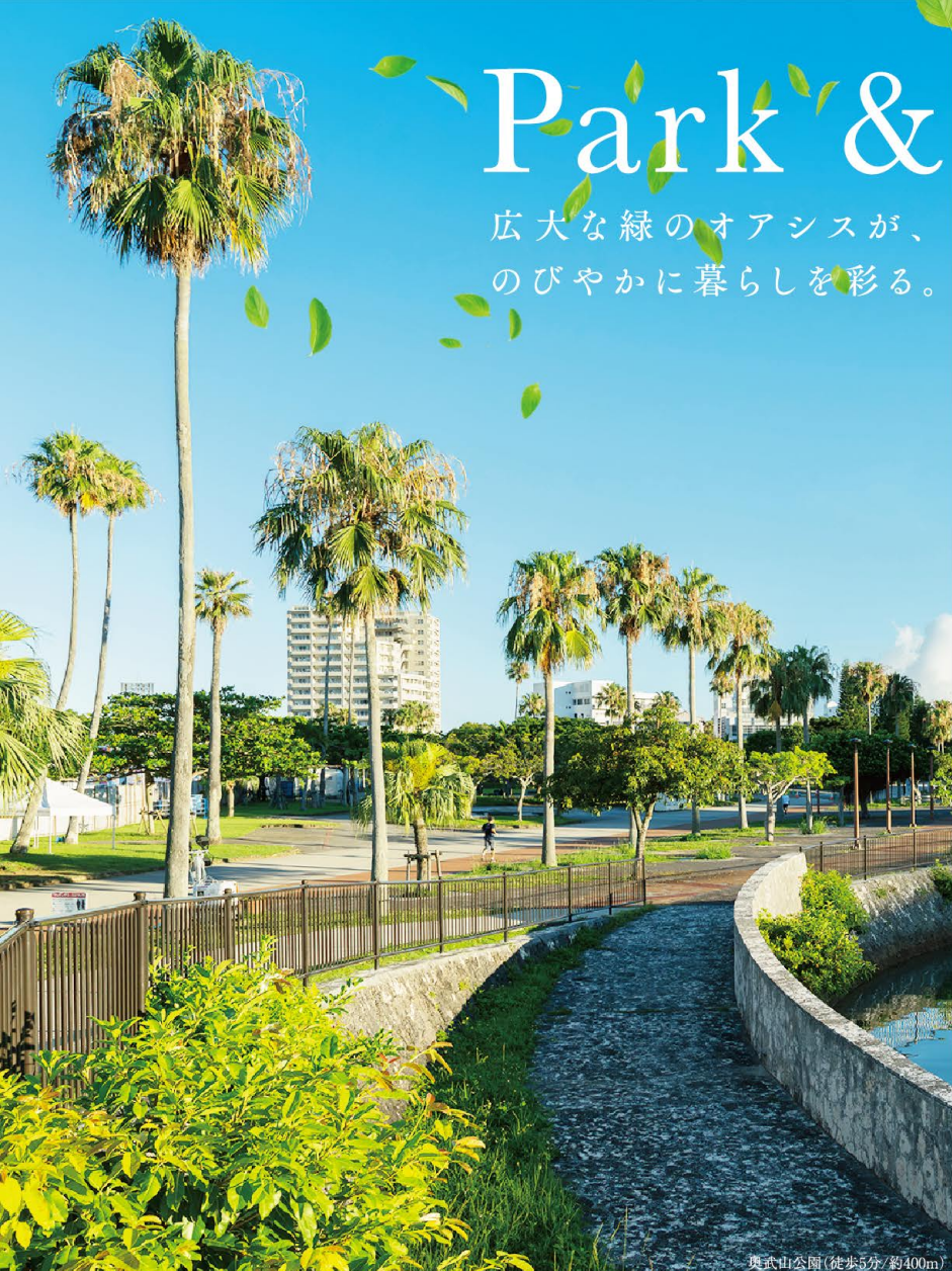
奥武山公園(徒歩5分/約400m)