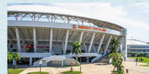
沖縄セルラースタジアム那覇(奥武山公園内)

プロ野球のキャンプ地としても知られるスタジアム。 NAHAマラソンやヨガ教室など、多彩なイベントが開催されています。