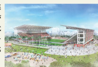
※令和13年度供用開始予定(イメージ図)

奥武山公園では現在、観客席1万人規模の「J1規格スタジアム」を整備する計画が推進されています*。完成後はJリーグの試合のほか、民間のスポーツ大会等も開催予定。活気あふれるスポーツの楽園として、那覇のオアシスはますます進化していきます。