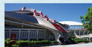
沖縄県立武道館(奥武山公園内)

剣道や柔道だけでなく、コンサートや展示会なども開催される、最大3,000人を収容可能な武道館。