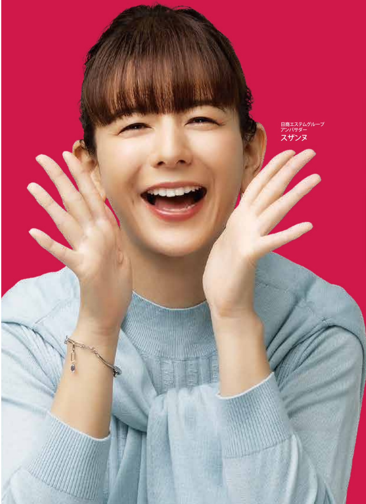
日商エステムグループ アンバサダー スザンヌ

3LDK 3,880万円 より 月々のご返済 6万円 台より ■Bタイプ(902号室)3LDK 販売価格 3,880万円(消費税込) 頭金0円 詳しくはチラシ裏面で